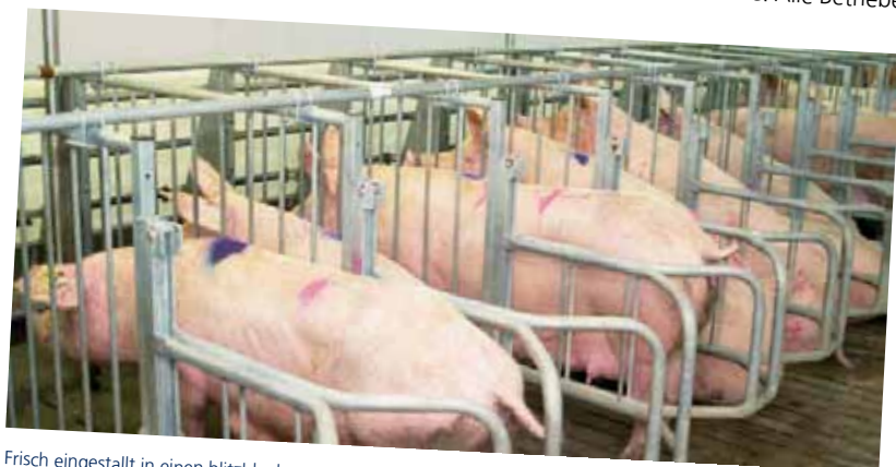
Frisch eingestallt in einen blitzblanken Stall: Die VVL liefert Georg Thiele jede Woche im Schnitt 80 Saunen zum Decken. Absolut ruhig und zügig geht das Einstellen vonstatten. Die Saunen sind den Wechsel gewohnt.

Vornholz: Nein, die Größe spielt keine Rolle. Lediglich im Abferkelbereich sollten 50 Plätze angestrebt werden. Alle Betriebe