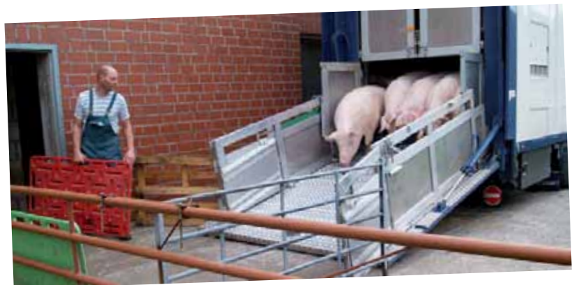
Anlieferung der leeren Sauen im Betrieb von Georg Thiele in Drensteinfurt-Mersch. Mit demnächst rund 1200 Sauen ist der auf den Deck- und Wartebereich spezialisierte Sauenhalter der größte im Programm der Arbeitsteiligen Sauenhaltung der Viehvermarktung Lüdinghausen.

Ein einziger JSR-Betrieb in Ostdeutschland vermehrt die Jungsauen und liefert sie an zwei spezielle Aufzuchtbetriebe, die die Tiere von 30 bis 115 kg aufziehen. Hier durchlaufen sie ein auf die Funktionskette abgestimmtes Impfprogramm. Mit dem Schweinegesundheitsdienst NRW ist ein ständiges Gesundheitsmonitoring vereinbart, so dass das Impfprogramm jederzeit angepasst werden kann.